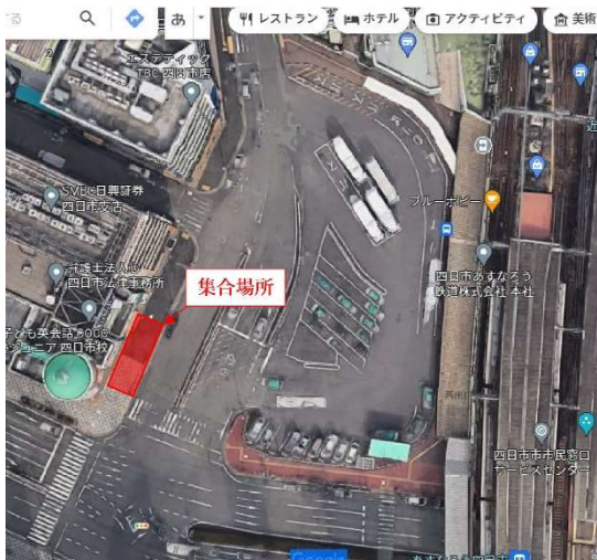
近鉄四日市駅西口ロータリーの三十三銀行様前